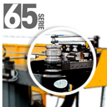
Curvadora de tubo Serie 65: